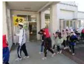
火災を想定した避難訓練