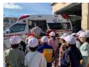
2年生：校外学習で消防署玉穂出張所へ