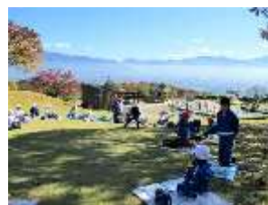
1年生：生活科校外学習でフルーツ公園へ