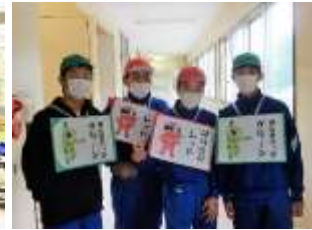
学級ごとの児童会「あいさつ運動」の取組