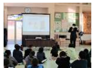
5年生：情報モラル学習会